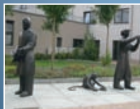
Humboldtparcours in Tegel eröffnet