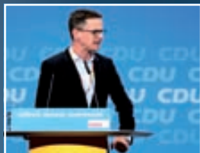
Gast beim „59. Tegeler Gespräch am 11. 7. 2019 Dr. Carsten Linnemann