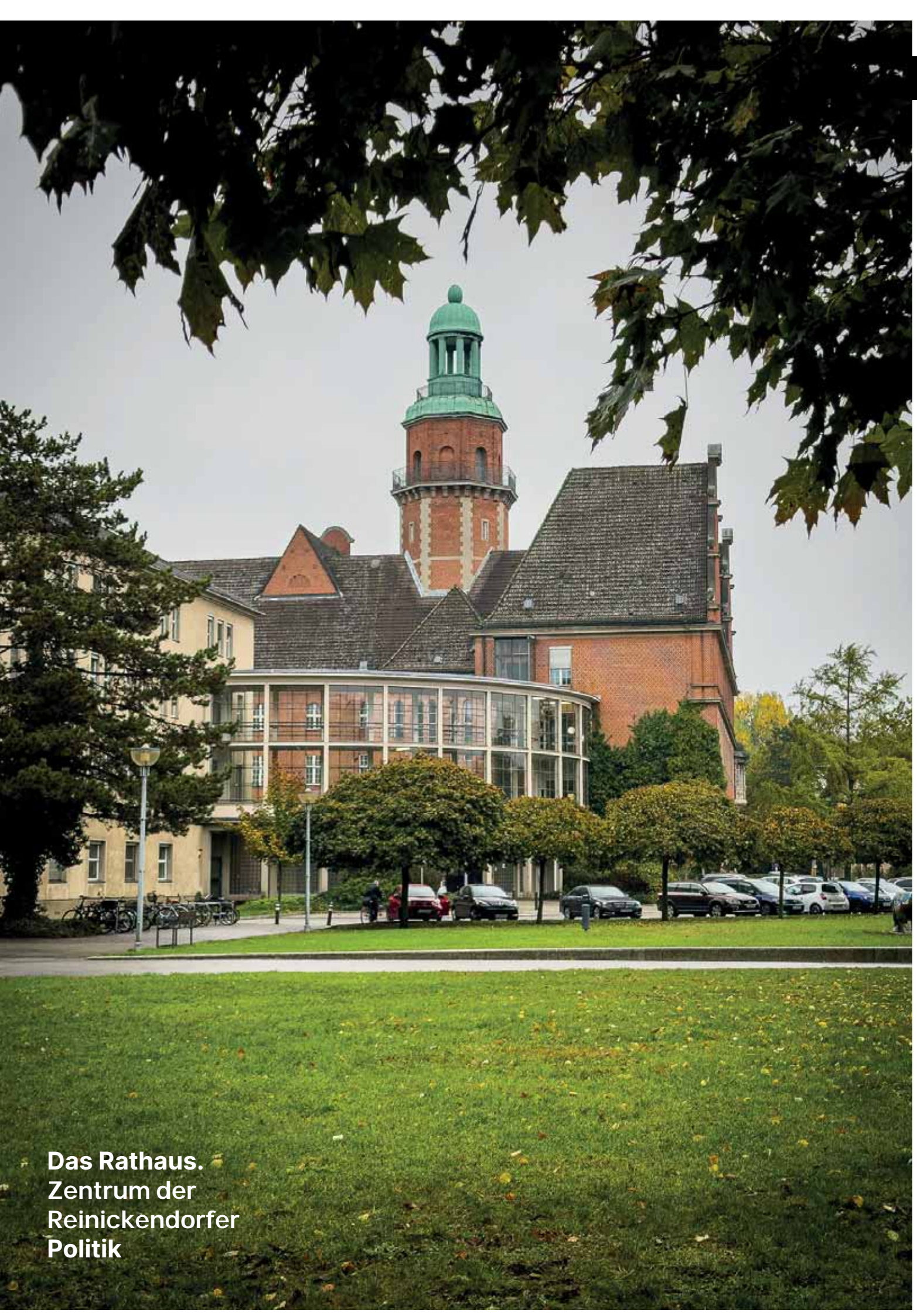
Das Rathaus. Zentrum der Reinickendorfer Politik