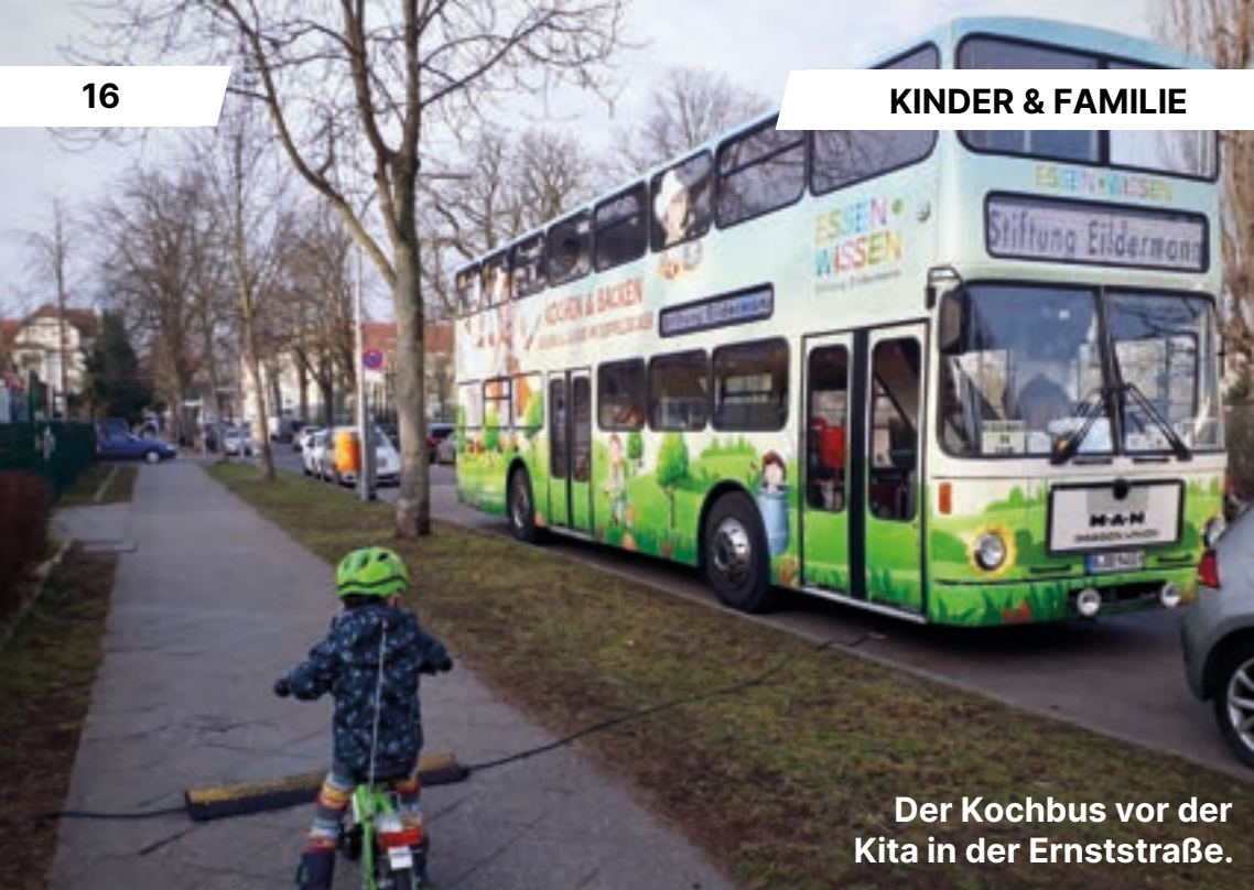
Der Kochbus vor der Kita in der Ernststraße.

Das Team von ALEX PRO PFLEGE steht Ihnen mit Herz und Verstand zur Seite – gut organisiert, bestens besetzt und immer für Sie da. Wir legen großen Wert auf persönliche Betreuung und echte Fürsorge.