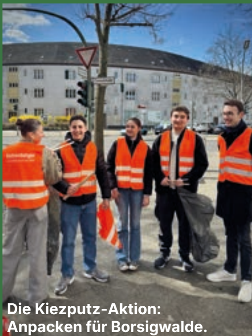
Die Kiezputz-Aktion: Anpacken für Borsigwalde.