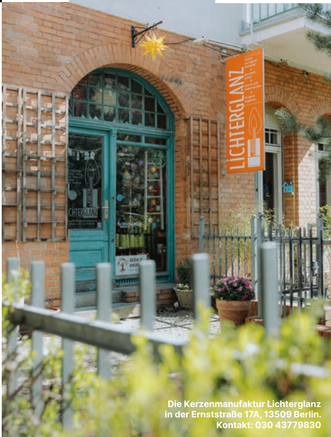
Die Kerzenmanufaktur Lichterglanz in der Ernststraße 17A, 13509 Berlin. Kontakt: 030 43779830