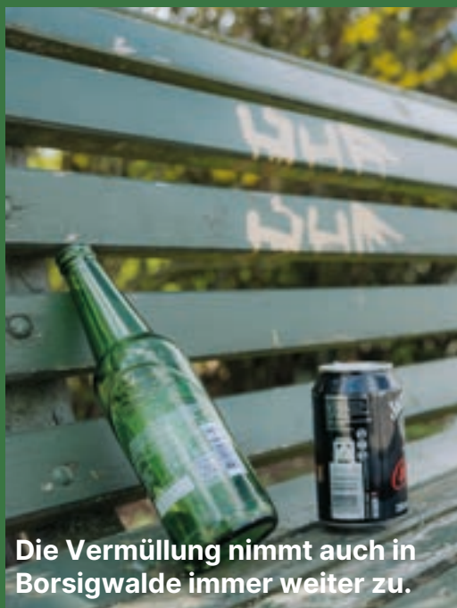
Die Vermüllung nimmt auch in Borsigwalde immer weiter zu.