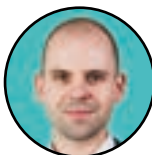
MARVIN SCHULZ Bundestagsabgeordneter für Reinickendorf

unterwegs ist, kommt auch ans Ziel. Vielleicht gründe ich zeitnah eine Laufgruppe für die Strecke zwischen Reinickendorf und dem Deutschen Bundestag.