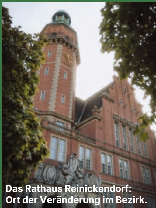
Das Rathaus Reinickendorf: Ort der Veränderung im Bezirk.