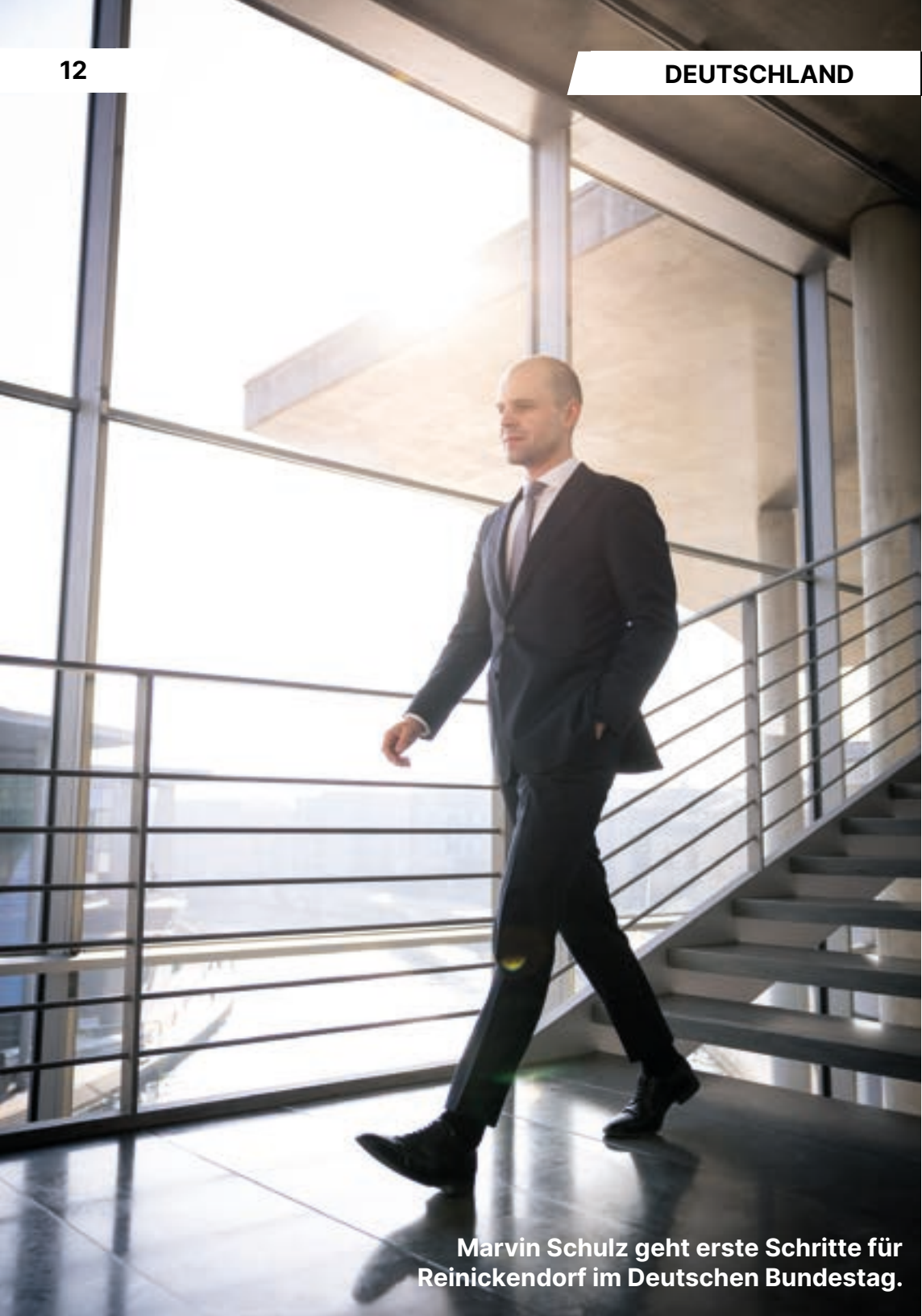
Marvin Schulz geht erste Schritte für Reinickendorf im Deutschen Bundestag.