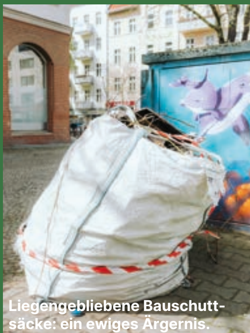
Liegegebliebene Bauschutt- säcke: ein ewiges Ärgernis.